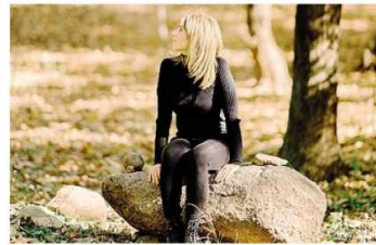
La nuova offerta punta tutto sulla natura e sul benessere