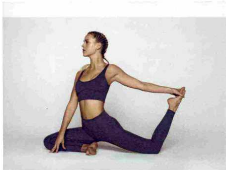
YIN E YANG Variante del Kapotasana, detta anche posizione del Piccione Reale. Durante l'esecuzione, si lavora su due aspetti energetici del corpo, lo yin femminile e lo yang maschile.